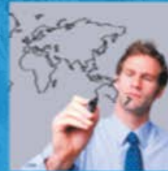
Sterke posities & geografische groei