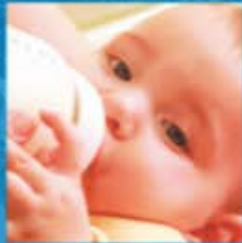
Kindervoeding (B2B, B2C)