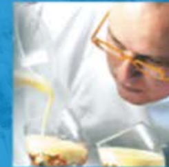
Foodservice in Europa